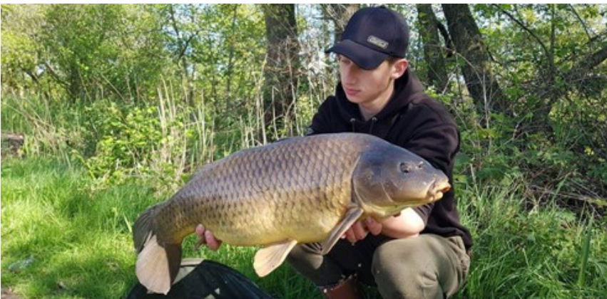
Ook een oude lange vis die inmiddels een mooi gewicht bereikt