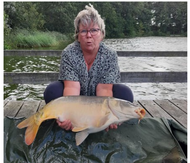
Één van de zwak beschubte spiegels uit 2013/2015