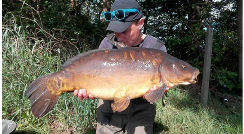
Een van de oude valkenwaard spiegels die onze plassen rijk zijn