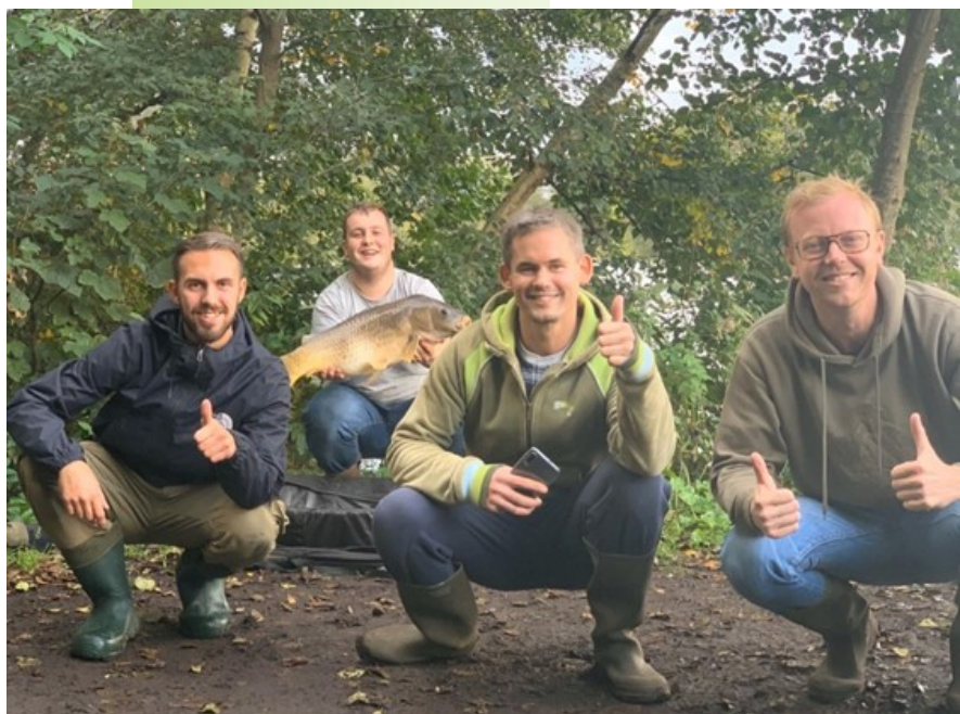
Een van de winnende vissen