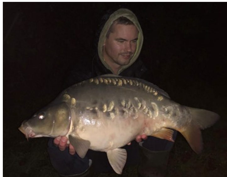
En nog een aantal vangsten van uitzetters en het oude bestand