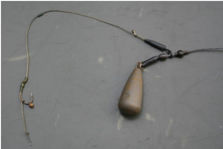
Op deze manier een visveilige helicoptermontage

Let er ook bij dit systeem goed op dat de beads en/of kralen kunnen schuiven en dat de onderlijn vrij over de leader (ook over de knoop) en/of hoofdlijn kan schuiven.