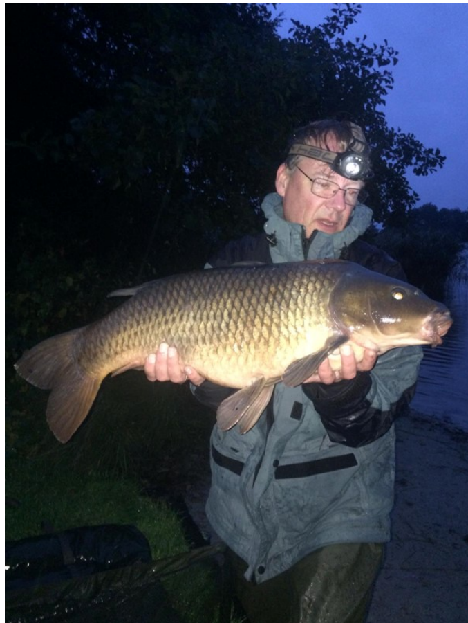
Een langgerekte schub zoals iedereen die we wel kent