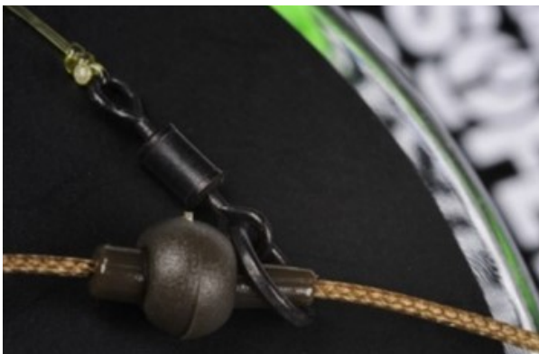
Deze bead schiet los bij een lijnbreuk

Wanneer je met een leader vist moet je er wel goed rekening mee houden dat de knoop waarmee de leader aan de hoofdlijn vastzit niet te groot is en dat de chodrig hier makkelijk overheen kan schuiven.