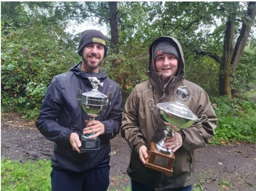
De winnaars van dit jaar