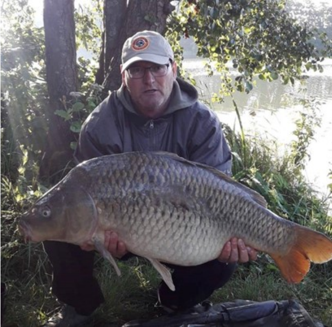
Deze oude strijder kwam ook in 2019 weer met enige regelmaat op de mat

Wij blijven iedereen vragen om foto's op te sturen zodat wij ons een goed beeld van het bestand op onze wateren kunnen vormen en op die manier ook ons visstandbeheerplan daar waar nodig kunnen bijsturen.