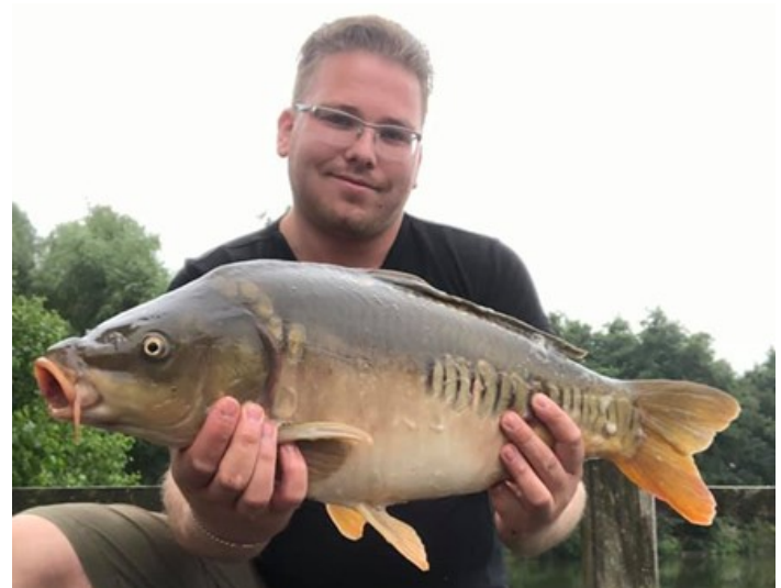
2 schitterende, in 2013/2015 uitgezette hoogbouwde schubkarpers